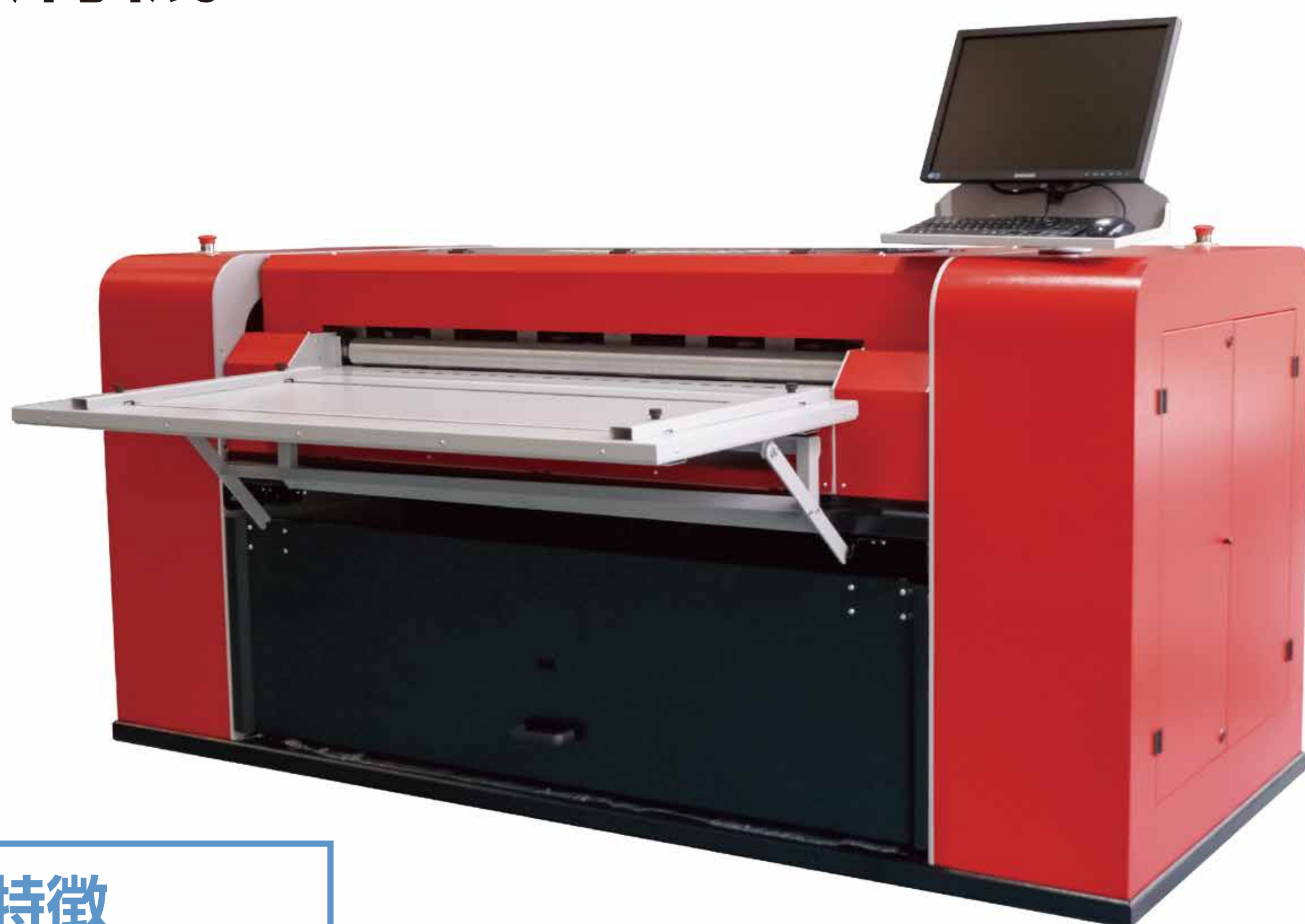
MULTI LG 1200