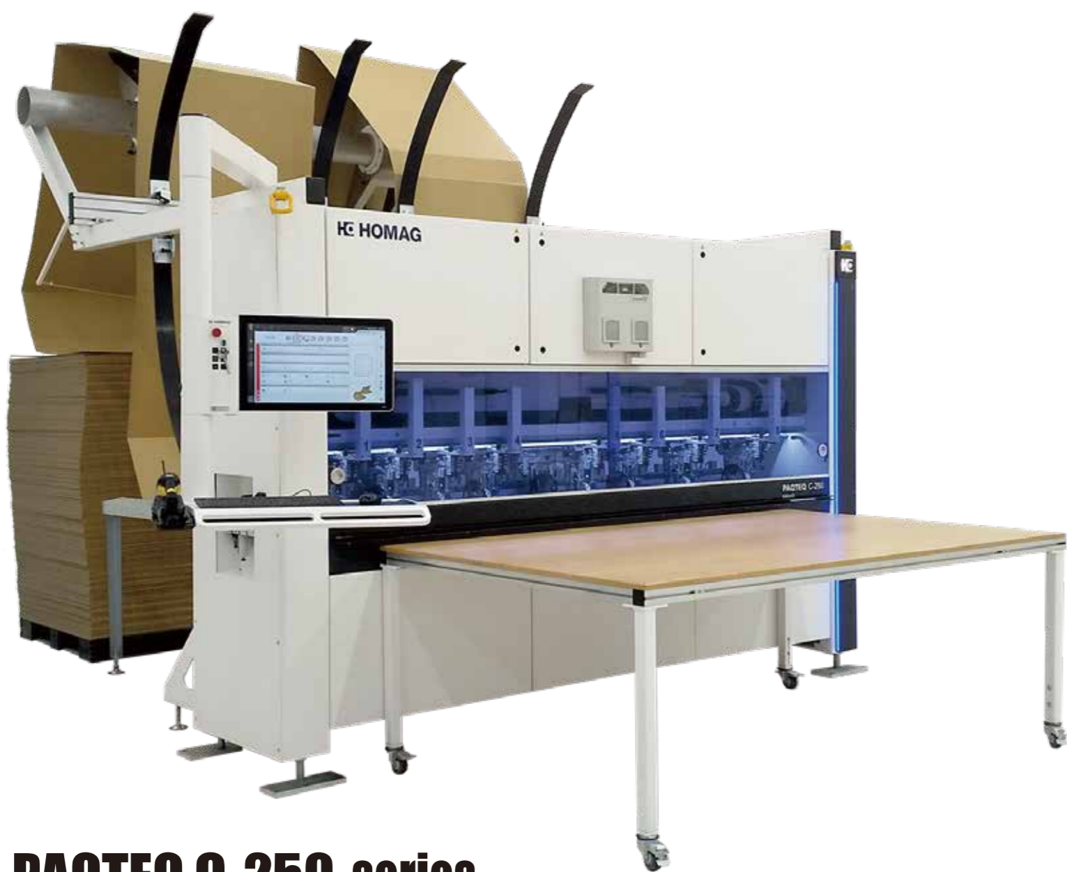
HOMAG PAQTEQ C-250 series